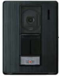
カラーカメラ付玄関子機