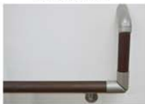
RW色 ロイヤルウォール