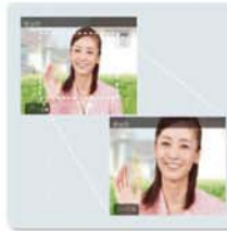
来訪者をズームアップして確認。