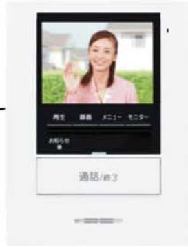
カラーモニター付親機